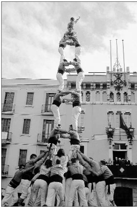
Dos de vuit folrat que carregaren ahir els Sants. JOAQUIM ANDRES