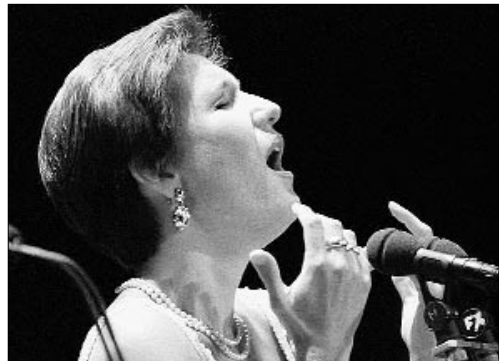
Isabel Rey durante una actuación en Tarragona en 1998.